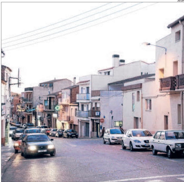
El carrer Lleida d'Alpicat, que l'ajuntament vol millorar.

D'altra banda, la comissió de govern municipal va aprovar ahir el projecte d'ampliació del menjador del col·legi públic Doctor Serés, de cara a futures matriculacions d'alumnes, ja que l'actual ha quedat petit; i també la reforma de l'accessibilitat i l'adequació de serveis de l'escola per a la supressió de barreres arquitectòniques, que inclouen instal·lar rampes a les escales. Suposarà una inversió d'uns 340.000 euros, que es pagaran amb els fons de l'Estat.