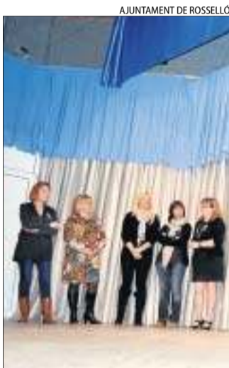
AJUNTAMENT DE ROSSELLÓ