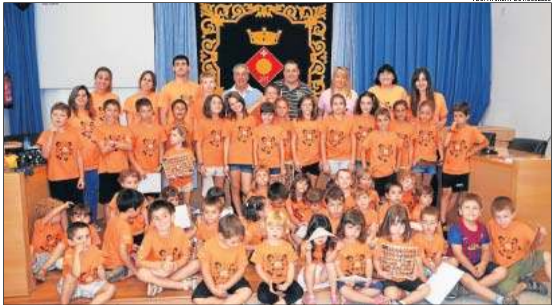
Els nens de Rosselló van visitar l'ajuntament i els estudis de la ràdio del poble.

En canvi, lus participants en la Ludoteca d'Estiu de Mequinensa fan activitats relacionades amb l'educació ambiental com jocs a través de l'observació, la fauna i la flora de la zona.