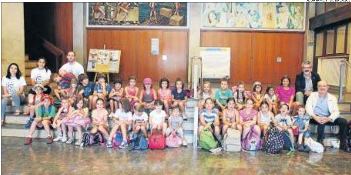
Una trentena de nens de Balaguer participen en el programa d'activitats 'Temps Afegit'.