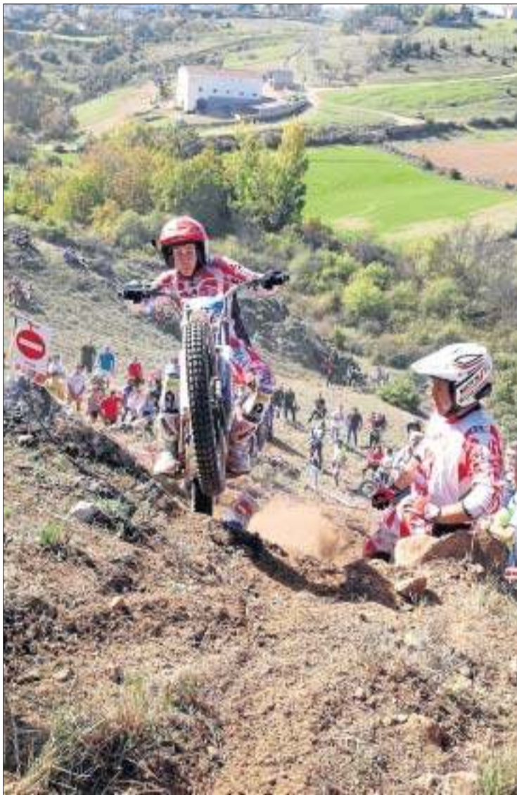
El lleidatà, superant una de les zones de la prova madrilenya.