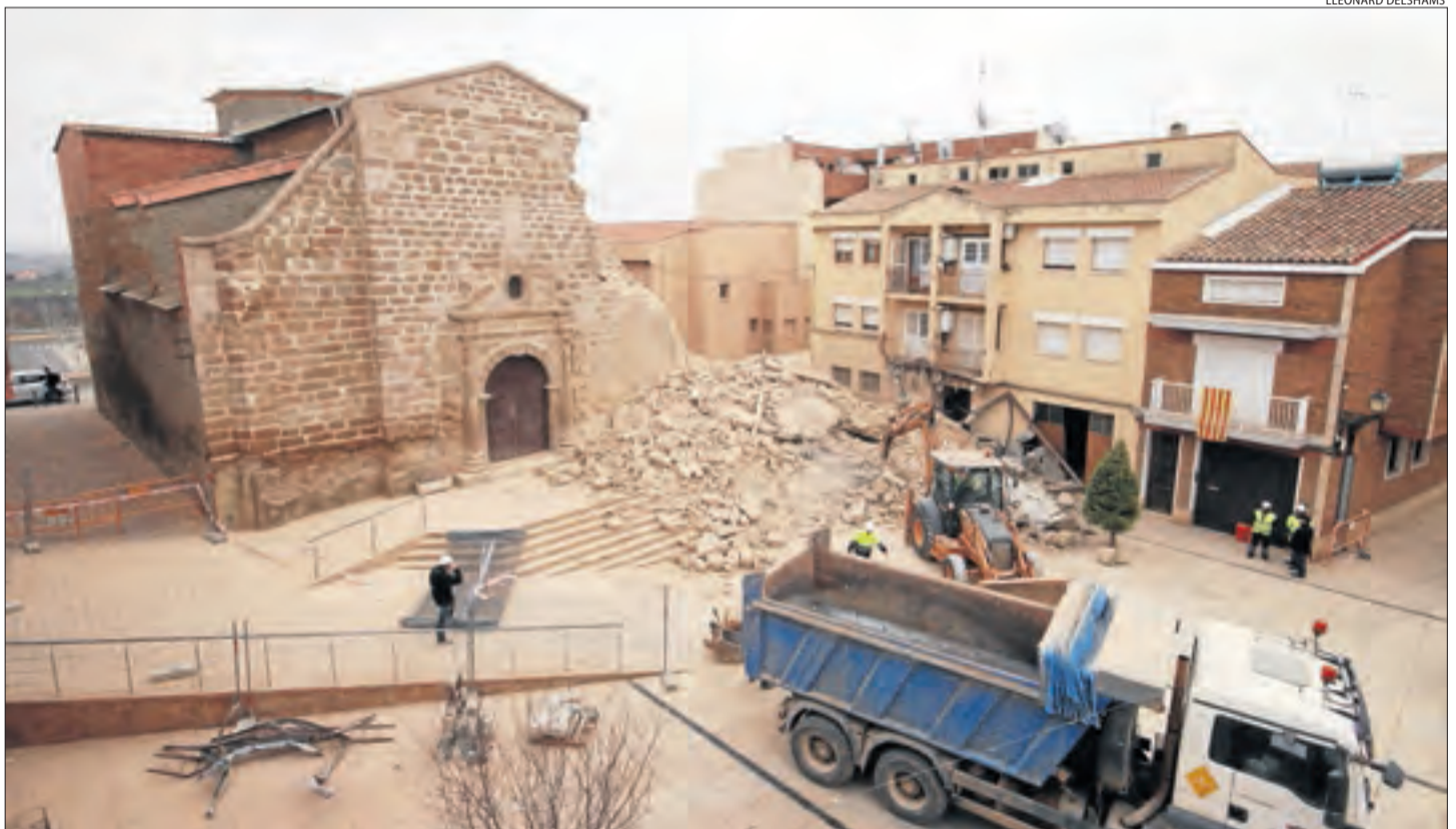
Els treballs per retirar la runa del campanar i part de la façana de l'església després de l'ensorrament.