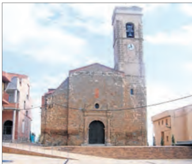
L'església de Rosselló va ser objecte d'obres per donar alçada al campanar i fer caure la rectoria.

Ni el bisbat ni l'ajuntament no tenen encara conclusions definitives pel que fa a les causes de l'ensorrament. L'arquitecte contractat per la diòcesi per avaluar els problemes del campanar no havia conclòs la investigació quan es va produir l'enfonsament. Les obres del 1990 per fer més alt el campanar no són l'única modificació recent que ha tingut l'església. A començaments de la dècada passada, en