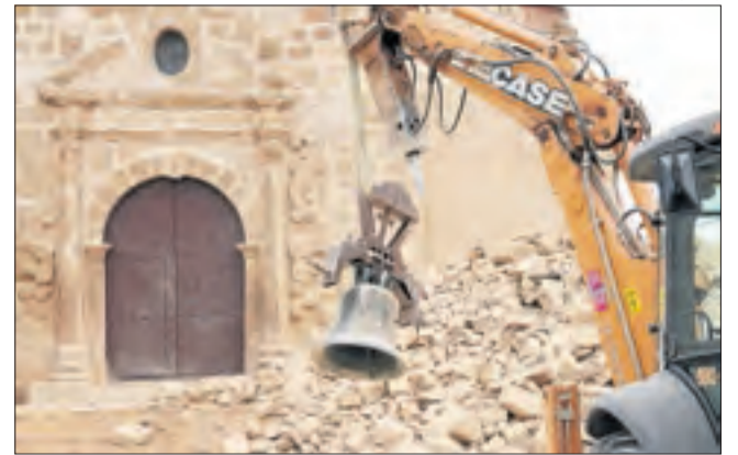
Operaris van recuperar les campanes entre la runa.

Seqüència de l'interior de l'església, coberta de runa a l'enfonsar-se part de la coberta amb la torre.