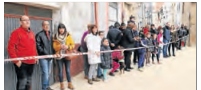
Molts veïns van anar a la plaça després de l'ensorrament.