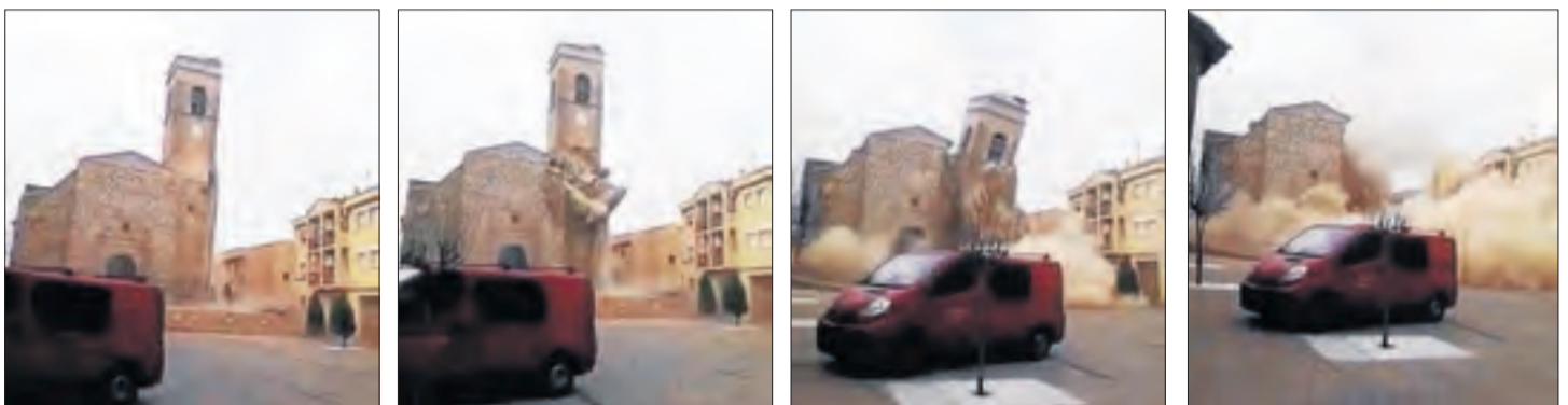
Seqüència d'imatges de l'enfonsament de la torre del campanar de l'església de Rosselló, que va danyar habitatges propers.