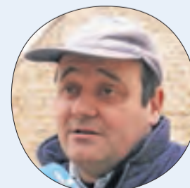
Alcalde de Rosselló, on ahir es va ensorrar una església

«Quan hem vist despreniments hem desallotjat els veïns de les cases properes i els hem portat a pisos del poble»