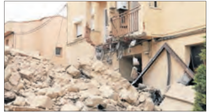
Danys en un habitatge per l'impacte de la torre al caure.