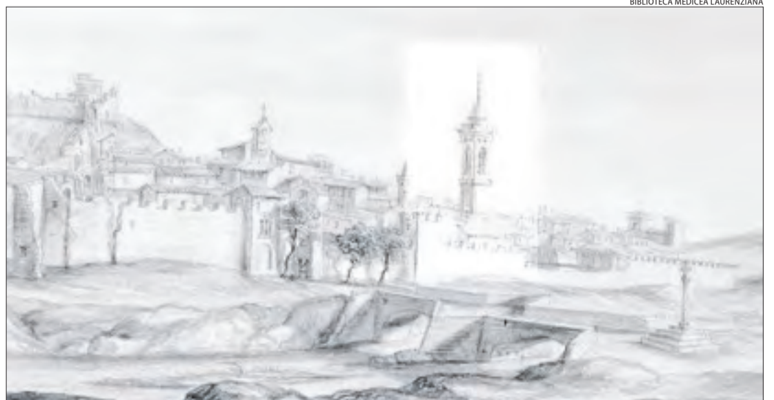
BIBLIOTECA MEDICEA LAURENZIANA

TÀRREGA | El 22 de novembre del 1671 es va reunir el consell de Tàrrega perquè la magnífica església gòtica de la capital de l'Urgell tenia esquerdes preocupants. Pel que sembla, un terratrèmol registrat el 1660 havia danyat l'edifici. Es va prendre una decisió per sortir del pas: tapar les esquerdes amb guix. No va servir de gaire. El 15 de febrer del 1672 el campanar va caure, va enderrocar tres capelles de l'església i una dona que vivia en una casa limítrofa va resultar morta. De la mateixa manera que a Rosselló, es va debatre si es remodelava l'església o s'enderrocava per construir-ne una de nova. I es va optar per la segona opció. Per sort, la gran portalada gòtica, de l'estil de la dels apòstols de la Seu Vella, no va quedar afectada i se'n conserven algunes figures esculpides en pedra al Museu Comarcal d'Urgell. Un gravat de Pier Maria Baldi,