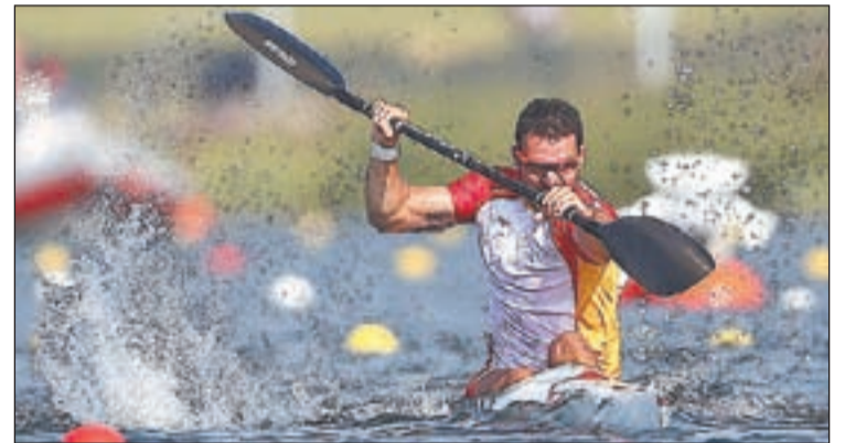
Craviotto busca su clasificación olímpica

La relación incluye 186 becas que ya tienen dueño (deportistas como Mireia Belmonte disfrutan de más de una, por participar en distintas pruebas), así como una mención a los equipos ya clasificados o con opciones de clasificarse para los Juegos, cuyos componentes aún no han sido designados. Las federaciones de natación (24 becarios), atletismo