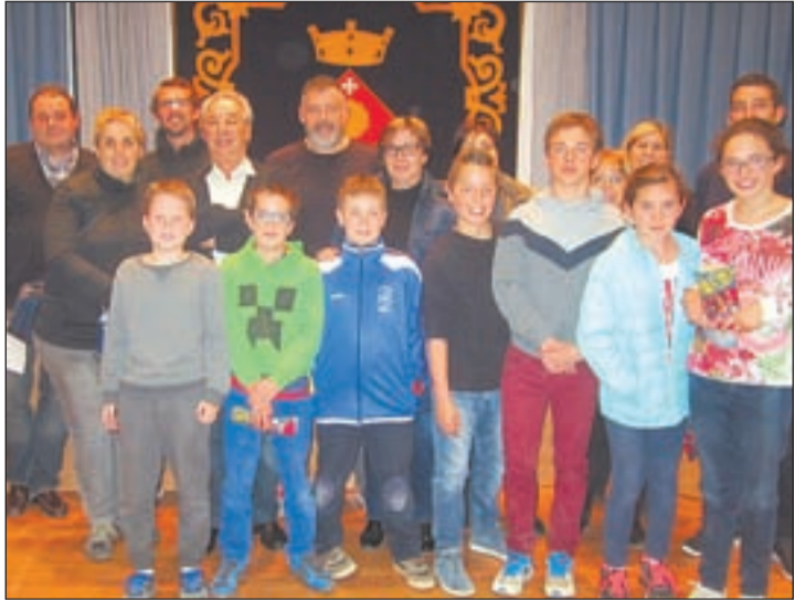
El proyecto se presentó en el ayuntamiento