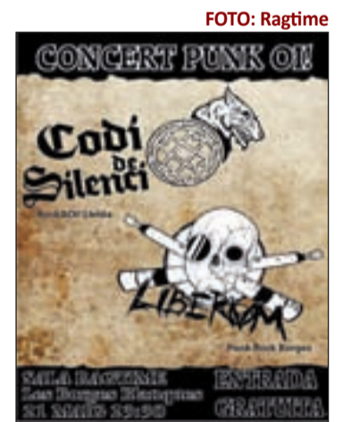
Cartel del doble concierto punk

La sala Ragtime de les Borges Blanques organiza esta noche (23.30 horas) un doble concierto monográfico de punk oi!, con entrada gratuita, en el que entrarán en liza los grupos Codi de Silenci (rock & oi! de Lleida) y Liberum (punk-rock de les Borges Blanques).