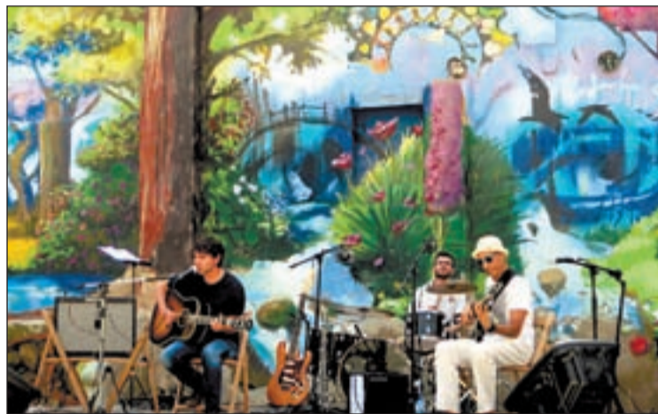
Green Zola, en uno de sus recientes conciertos