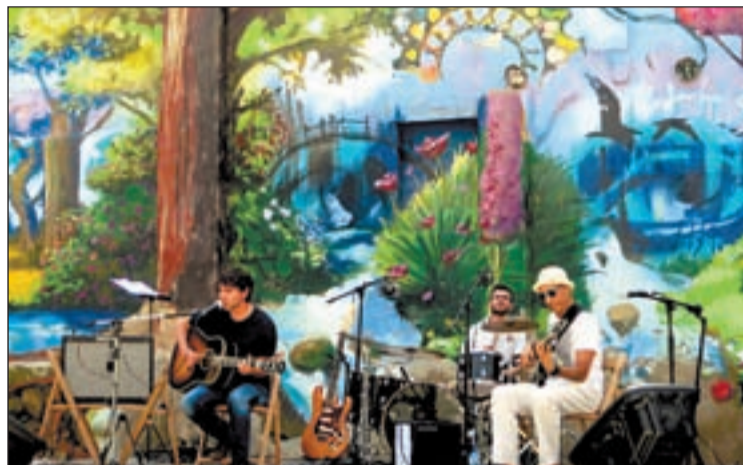
Green Zola, en uno de sus recientes conciertos