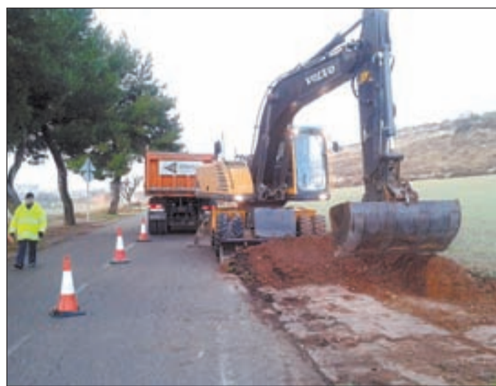
Les obres estan sufragades per la Diputació