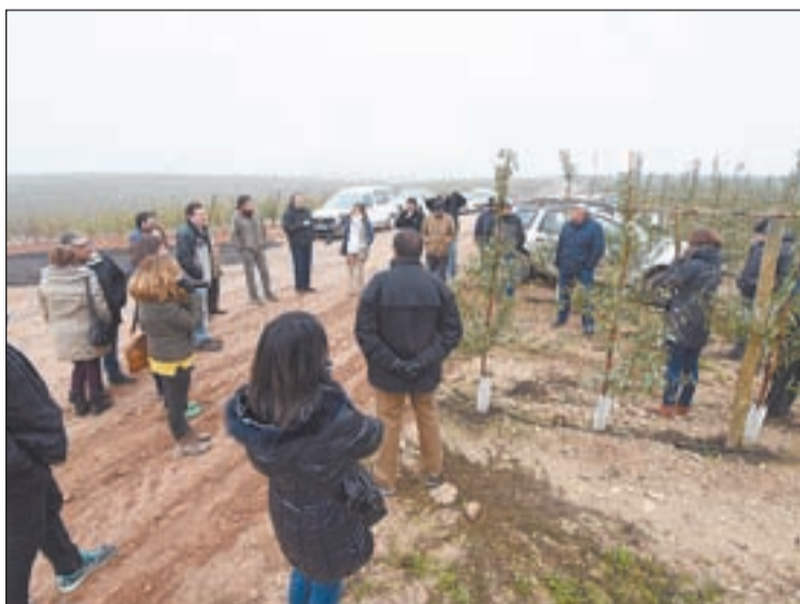
Els diversos productors visitant la finca de Sarroca

En aquesta ocasió, Serviplant va plantar entre maig i juny uns 3.000 ametllers per hectàrea en una finca de Sarroca de Lleida. "Avui hem presentat aquestes varietats a productors d'arreu d'Espanya, procedents per exemple de València, Alacant o Cordovà,