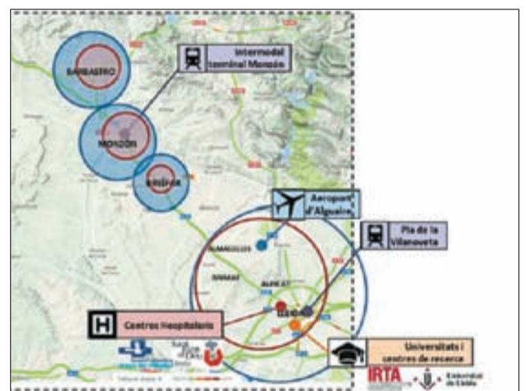
FOTO: / Mapa de la zona per on passaria el ramal entre Lleida i Montsó

Per altra part, també podria potenciar el transport ferroviari de mercaderies, amb ample mixt, que permetria impulsar el corredor ferroviari Saragossa-Montsó-Lleida i connectar-lo amb el Corredor Mediterrani, a la zona de Tarragona. El transport de mercaderies es podria centralitzar en dues grans terminals, la del Pla de Vilanoveta a Lleida i la de Montsó-Riu Cinca, connectant les dos grans àrees industrials d'aquestes ciutats. La connexió, permetria facilitar el transport de mercaderies, en tot el triangle lo-