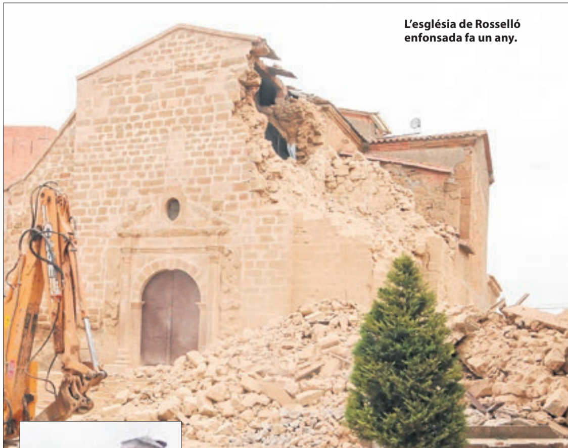
L'església de Rosselló enfonsada fa un any.