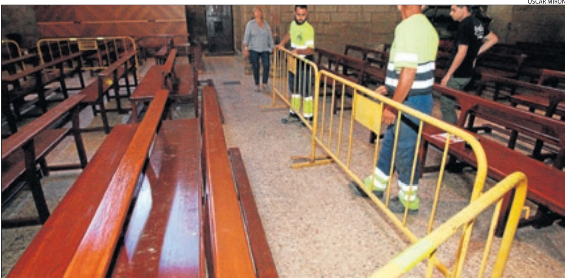
Despreniments a l'església d'Almenar van portar l'ajuntament a precintar diversos mesos l'altar.

Almacelles i la Granja d'Escarp tenen sobre la taula projectes del bisbat per canviar la coberta de les esglésies, els dos per sobre dels 100.000 euros. El primer ha obtingut una ajuda de 15.000 euros de l'IEI; el segon va optar també a la mateixa quantitat, però no