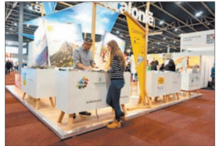
Imatge de la promoció de Lleida a la fira

La Diputació de Lleida, mitjançant el Patronat de Turisme, promou durant aquest cap de setmana l'oferta de natura i de turisme actiu del Pirineu i les Terres de Lleida a la Fiets en Wandelbeurs, la mostra de turisme actiu més important dels Països Baixos, especialitzada en ciclisme i senderisme que acull la ciutat holandesa d'Utrecht.