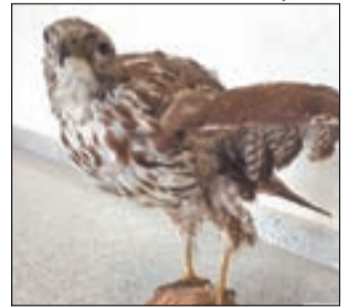
Imagen del ejemplar disecado

Denunciado en Solsona por disecar e intentar vender un ave rapaz protegida