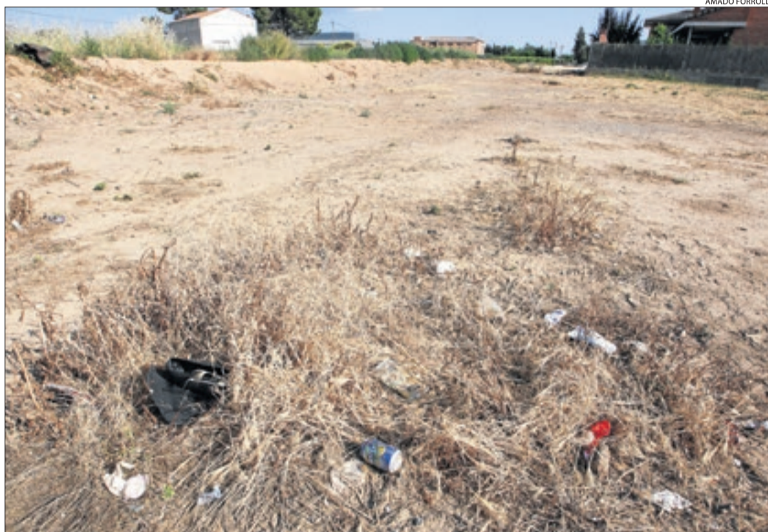
Un dels solars en mal estat que es poden trobar a Torrefarrera.

A Torrefarrera, el consistori notificarà ara als propietaris, que tindran deu dies per executar els treballs que siguin pertinents. Si no ho fan, podria portar a terme les tasques de neteja i sanejament pel seu compte i després passar al propietari el rebut amb les despeses que han