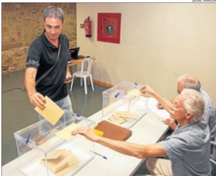
Un veí del Talladell, en l'elecció de vocals de l'EMD.

El 29 de gener del 2016, el vídeo de l'ensorrament del campanar de l'església de Sant Pere de Rosselló va fer la volta al món a través d'aplicacions de missatgeria i xarxes socials. La torre es va enfonsar al voltant de les 11.00 hores i va arrossegar part de la façana i la coberta del temple, va danyar dos habitatges que havien estat desallotjats i va provocar una fuga en una canonada de gas, que va quedar controlada poc després.