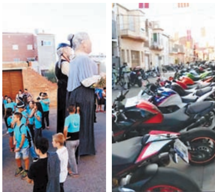
FOTO / A l'esquerra, la cercavila. A la dreta, la trobada de motoristes