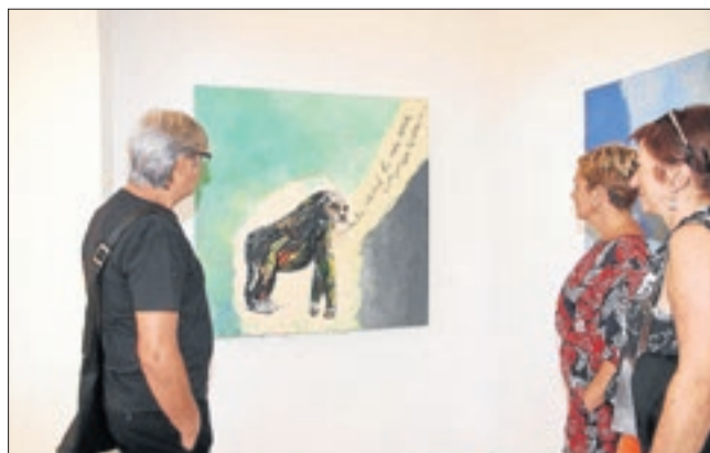
Exposició a la Fundació Guinovart d'Agramunt.

Guinovart. Cos percepció i resistència. Mostra diverses peces que comparteixen la singular expressió de la corporeïtat del pintor, els traços del qual, ferotges a vegades, generen obres potents. Fins al 17 de febrer.