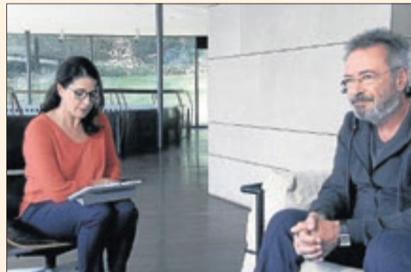
Un fotograma de la pel·lícula 'El ciudadano ilustre'.