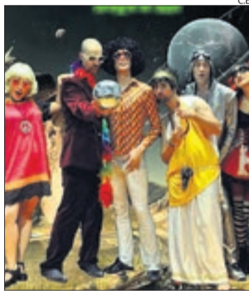
La Loca Histeria, dissabte nit.