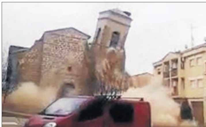
L'ensorrament del campanar, el 29 de gener del 2016.

La recuperació de l'església ha suposat una inversió d'uns 120.000 euros amb aportacions de la Generalitat i la Diputació i no inclou la reconstrucció del campanar caigut. Està previst en el projecte de rehabilitació, però haurà de ser objecte d'una