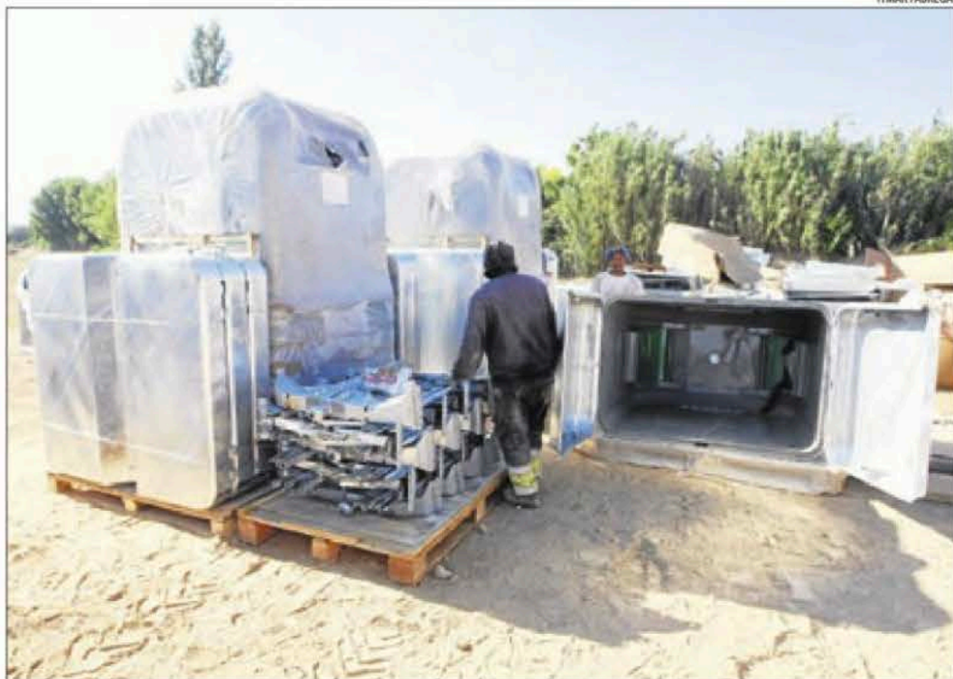
Imatge presa ahir dels contenidors que s'agrupen per a la distribució a Torrefarrera.

En poblacions de dimensions semblants a Aitona es col·locaran entre vint i trenta illes (en aquesta localitat del Baix Segre seran 24 illes i uns 120 contenidors) i, en aquest cas, serà una de les poques en què s'instal·lin sis punts amb contenidors més petits al nucli antic per facilitar la prestació. L'ad-