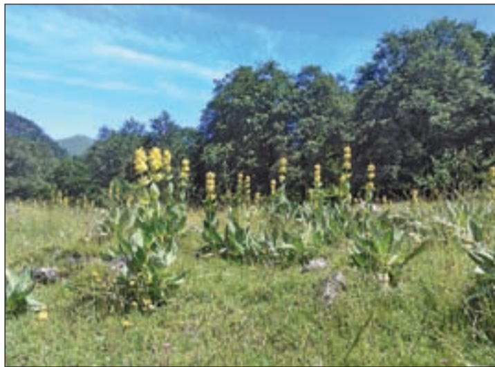
Volen cultivar una espècie vegetal

La de dificultat més alta s'anomena "Punta Plana" i compta amb un recorregut de 50 quilòmetres que transcorren per camins i pistes amb vistes als pantans de Mequinensa i Riba-Roja.