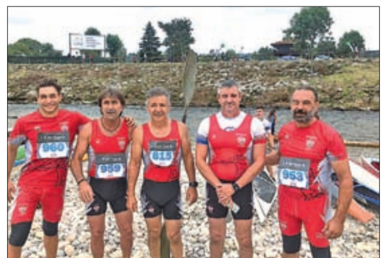
Los palistas leridanos rindieron a un gran nivel