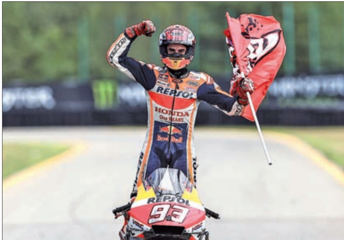
El leridano volvió a dominar de principio a fin en la carrera de Brno

Con 26 años todo hace indicar que su recorrido todavía parece