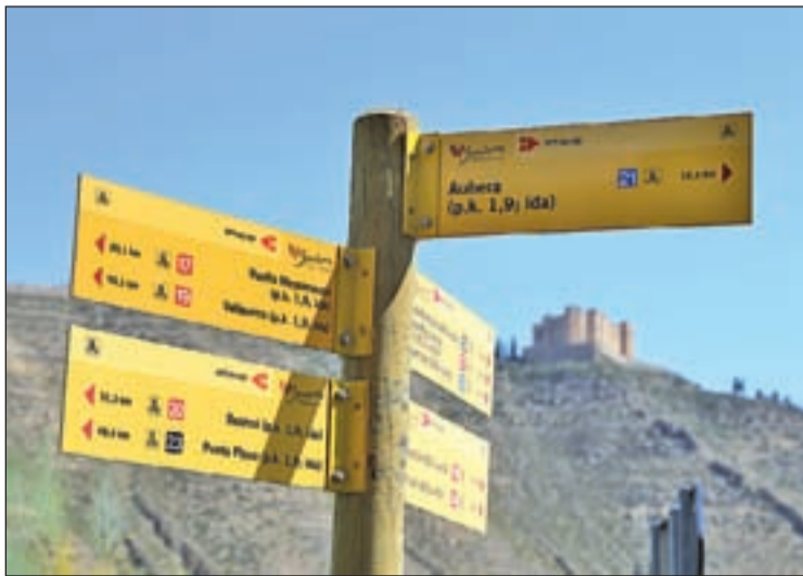
FOTO: Mequinensa / S'hi poden fer activitats ecuestres o senderisme