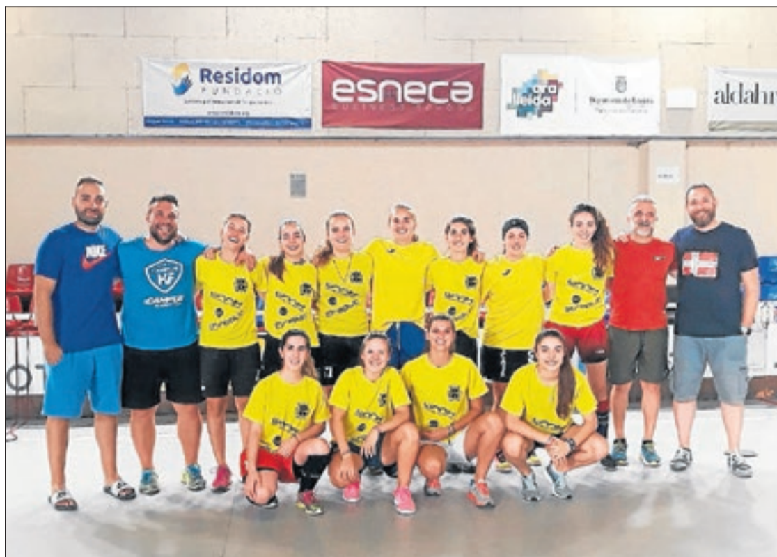
Jugadores i cos tècnic del Vila-sana, ahir en la primera sessió de la pretemporada.