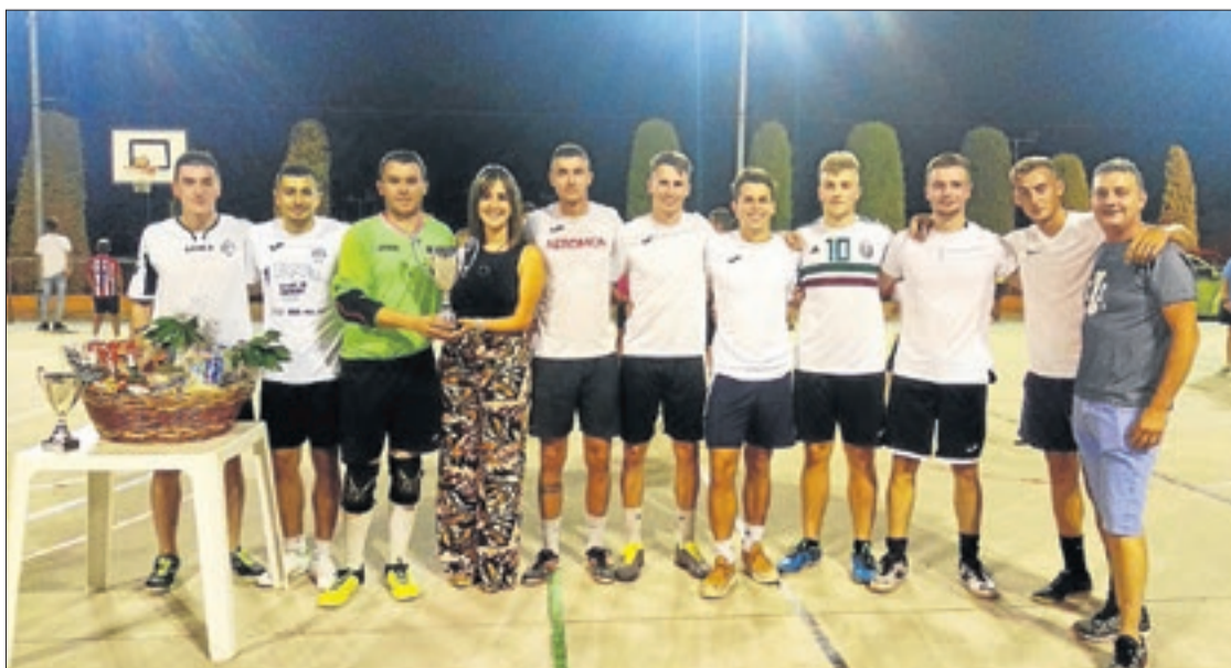
Entrega de trofeus a l'equip guanyador del Torneig de Futbol Sala de Rosselló.

Des de l'ajuntament d'aquesta localitat destaquen l'èxit de participació, així com la nombrosa presència d'espectadors a les grades del pavelló durant les jornades disputades. Els equips tornaran a tenir una cita l'estiu vinent.