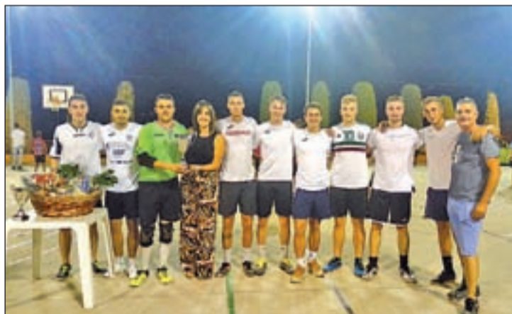
El torneo coronó a su campeón