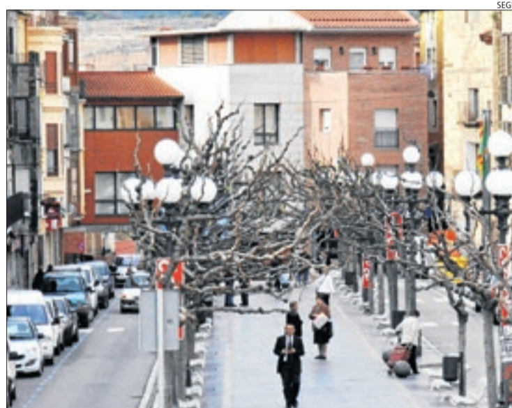
Imatge d'arxiu d'una vista del centre històric de Fraga.

El detingut es troba en dependències de la Guàrdia Civil d'Osca i passarà a disposició