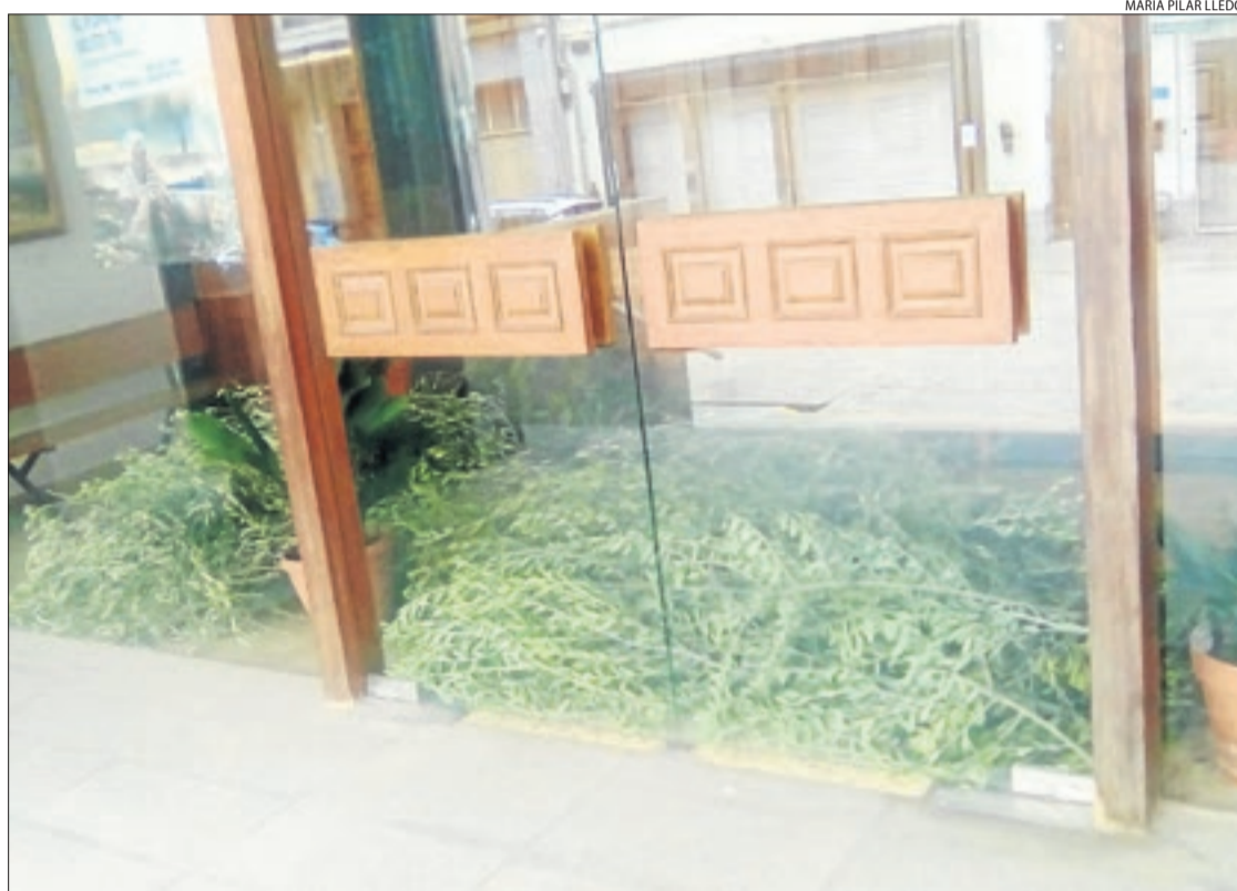
Vista de les branques d'olivera i lloer recollides per agricultors per Diumenge de Rams a Alfarràs.