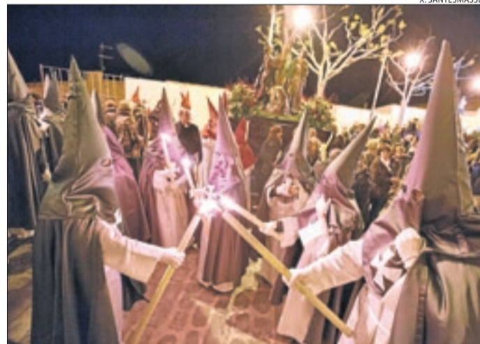
Edició de l'any passat de la processó dels Dolors de Bellpuig.

També ofereix un guió a les famílies per poder seguir les celebracions de la Setmana Santa (Diumenge de Rams, Dijous Sant, Divendres Sant i Diumenge de Pasqua) des dels seus domicilis.