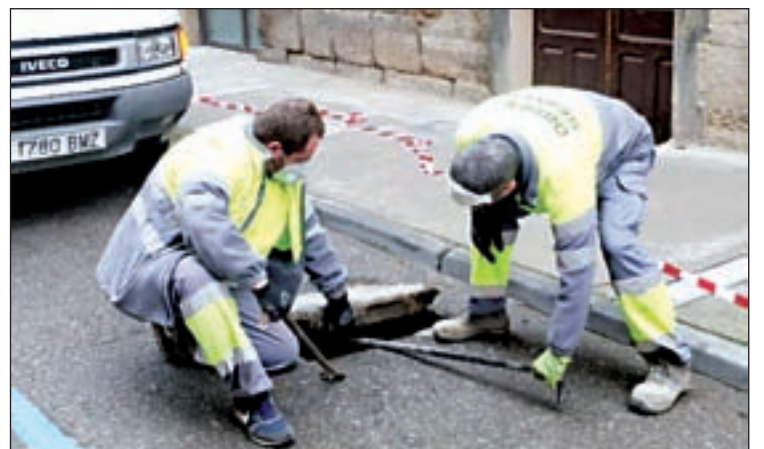
Els operaris, inspeccionant la part de sobre la sèquia

El projecte Camí de Sant Jaume.Xarxa pel Patrimoni centra el seu interès en el tram del trajecte que discorre entre Tàrrega i Alfaràs. De fet està previst que entre aquestes dues poblacions s'hi facin fins a vint actuacions de millora en el patrimoni de 17 municipis. En paral·lel, l'Ajuntament de Balaguer també va anunciar que aviat s'obrirà al públic el jardí arqueològic del Castell Formós de la capital de la Noguera.