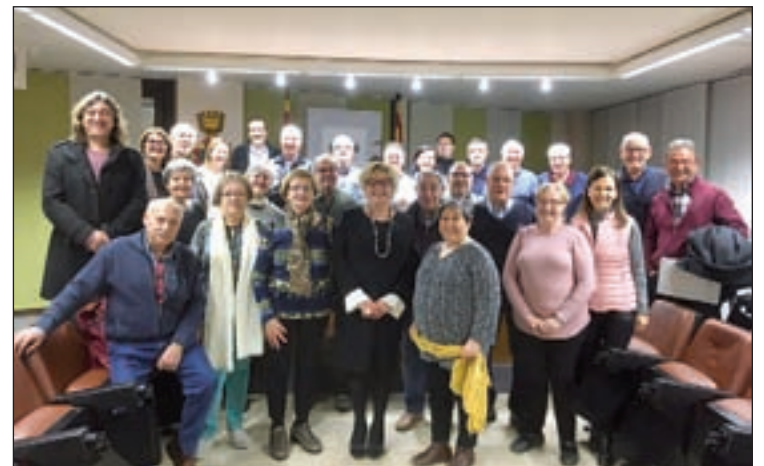
El ciclo coral cuenta con muchos adeptos

De momento, se mantienen los seis conciertos del próximo otoño, programados en Aitona, Sudanel, Seròs, Torres de Segre, Soses y Torrefarrera, a la espera de la evolución de la situación y siempre que las recomendaciones sanitarias lo permitan. El ciclo Segrià Coral moviliza a más de 2.000 personas.