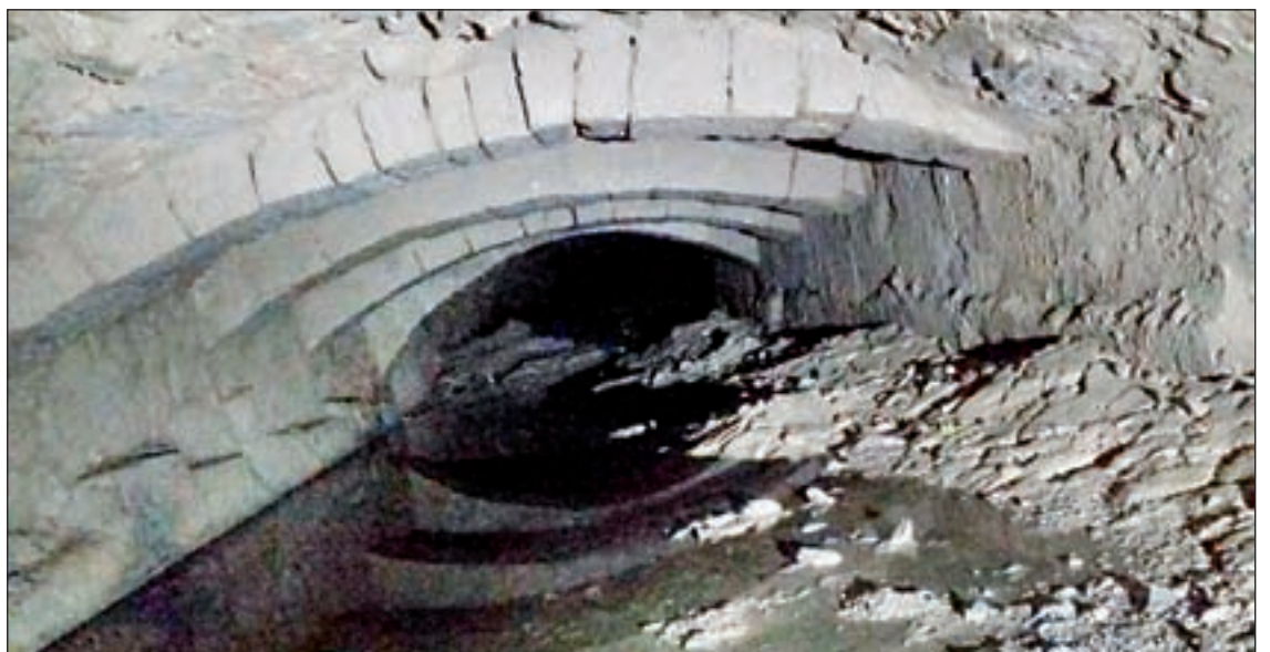
La sèquia del Cup discorre per sota del Centre Històric al seu pas per la capital de la Noguera