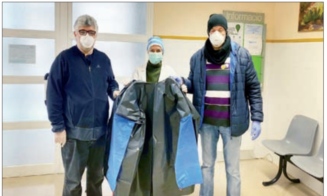
FOTO / A Torrelameu van fer bates pel CAP i el consultori de Balaguer i la residència de Vilanova de la Barca

Una de les claus perquè els alcaldes ponentins es mantinguin informats dels casos de coronavirus als seus pobles són els metges i infermers que els donen servei al poble o al consultori que fa funcions circumstancials de CAP. Aquests professionals sanitaris es mantenen en contacte diari amb els alcaldes i alcaldesses, i els avisen si detecten algun positiu o algun indici de cas al poble. Mentre que la Llei de protecció de dades prohibeix la divulgació d'informació dels malalts, per evitar que siguin estigmatitzats, els alcaldes coneixen la informació per activar protocols preventius i proveir del que necessitin els veïns afectats.