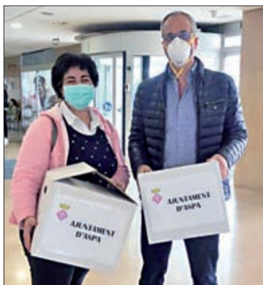
FOTO / L'alcaldesa d'Aspa i altres voluntaris han confeccionat mascaretes, roba i fins i tot pantalles