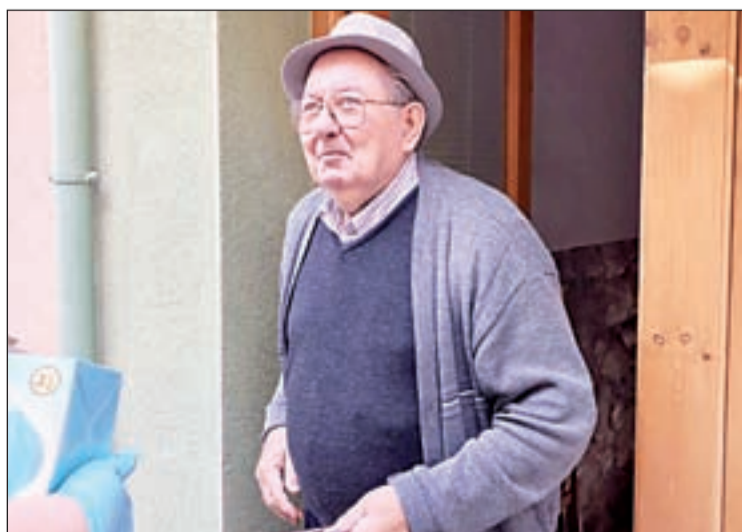
FOTO/ Un padri de Castellans rep la compra a casa gràcies als voluntaris