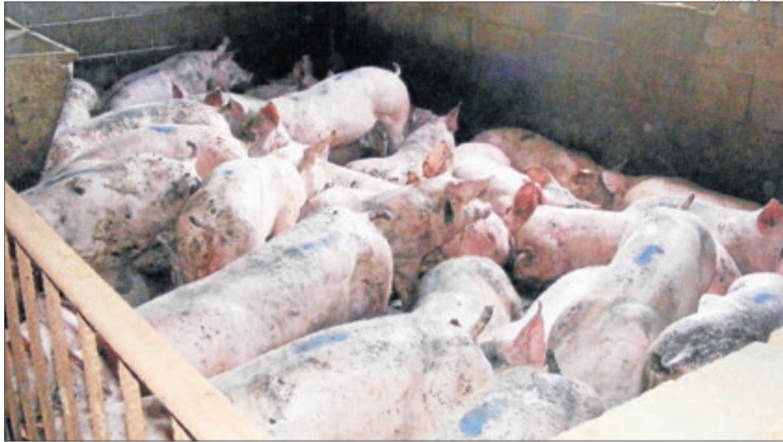
Imatge d'alguns dels porcs robats que van ser trobats a la granja del detingut.

La detenció és el resultat d'una investigació iniciada el 18 d'abril, al tenir coneixement que en una explotació ramadera de Juneda es va produir un robatori amb força. Algú va forçar l'accés a la granja i va sotstreure 140 porcs valorats en uns 25.000 euros. Tot just cinc dies després, es va produir un segon robatori amb el mateix modus operandi en una granja de Torregrossa, on van sotstreure 42 porcs valorats en uns 4.200 euros. Finalment, dimecres passat es va consumir un tercer robatori en una granja del Alamús, on van desaparèixer un total de 91 porcs valorats en