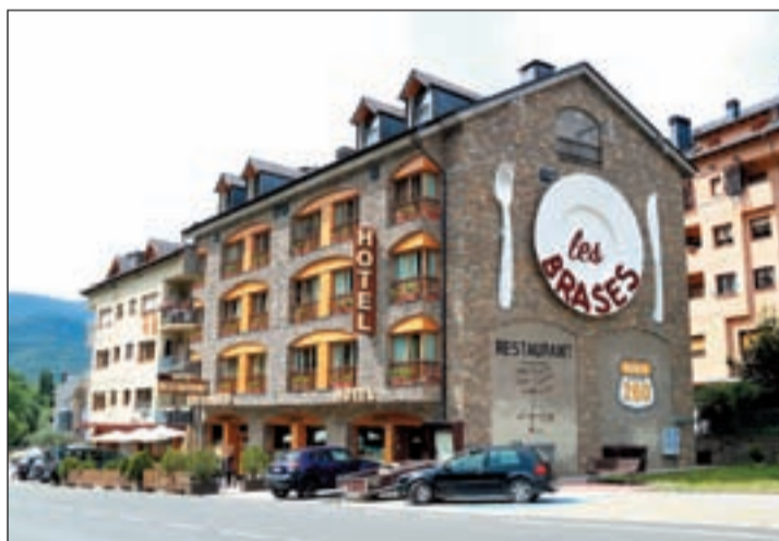
L'hotel Les Brases és un dels que ja ha obert