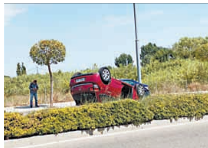
El vehicle després de sortir-se'n de la via