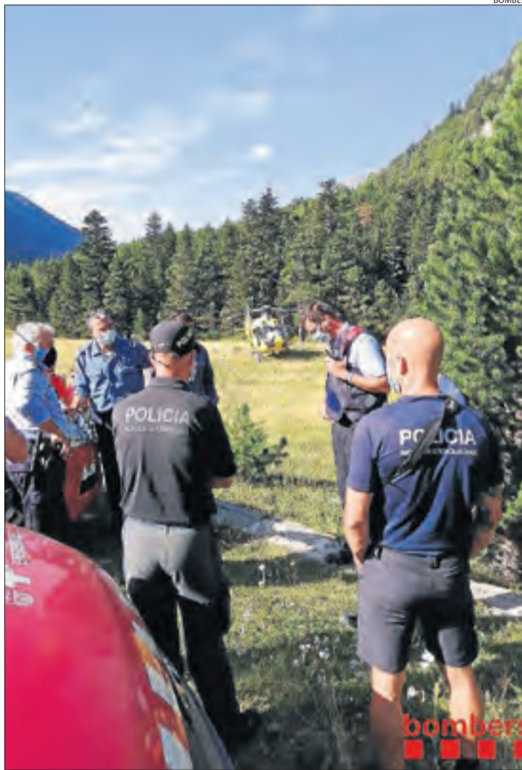
Bombers i Mossos al preparar el dispositiu ahir al matí.

Aquest any hi ha hagut tres accidents més de muntanya. Una dona va ser arrossegada riu avall a Montgarri, a Aran, un jove va perdre la vida fent snow a Martinet i un esquiador va quedar sepultat per una allau fora de pistes a Baqueira Beret.