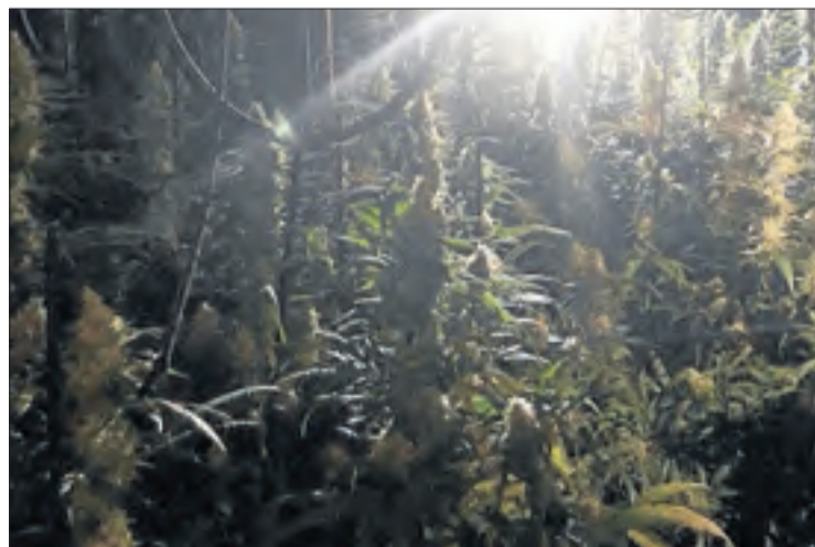
Imatge de la plantació de marihuana trobada a Rosselló.

| ROSELLÓ | Els Mossos d'Esquadra van detenir divendres un home a Rosselló acusat de ser el responsable d'una plantació de marihuana en la qual van trobar 376 plantes. L'arrest és fruit d'una investigació que van iniciar fa unes setmanes al sospitar que un veí d'aquesta localitat del Segrià podria estar dedicant-se al tràfic de marihuana i cocaïna. Després de diversos seguiments, divendres es va procedir a l'arrest de l'home i a l'escorcoll d'un immoble de la seua propietat. A l'interior, els investigadors van localitzar una plantació de marihuana preparada amb llums, ventiladors i altres materials, en la qual van trobar un total de 367 plantes. També van comprovar que tenia la llum punxada. Es desconeix si van trobar-hi altres drogues.