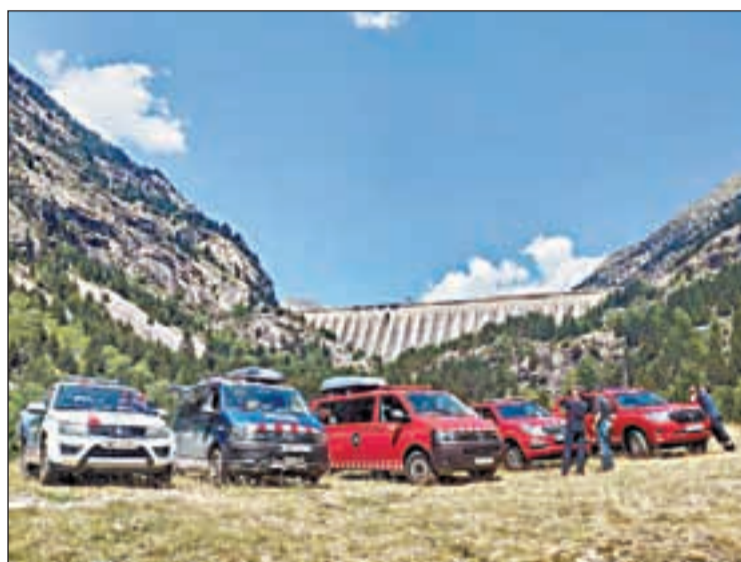
Una part de les dotacions que van fer el rescat

A primera hora d'ahir es va reprendre la recerca per amb cinc dotacions dels Bombers: dos vehicles, l'helicòpter amb efectius dels GRAE, una unitat canina, Pompiers d'Aran i a més, dues patrulles dels Mossos d'Esquadra de la unitat de muntanya.