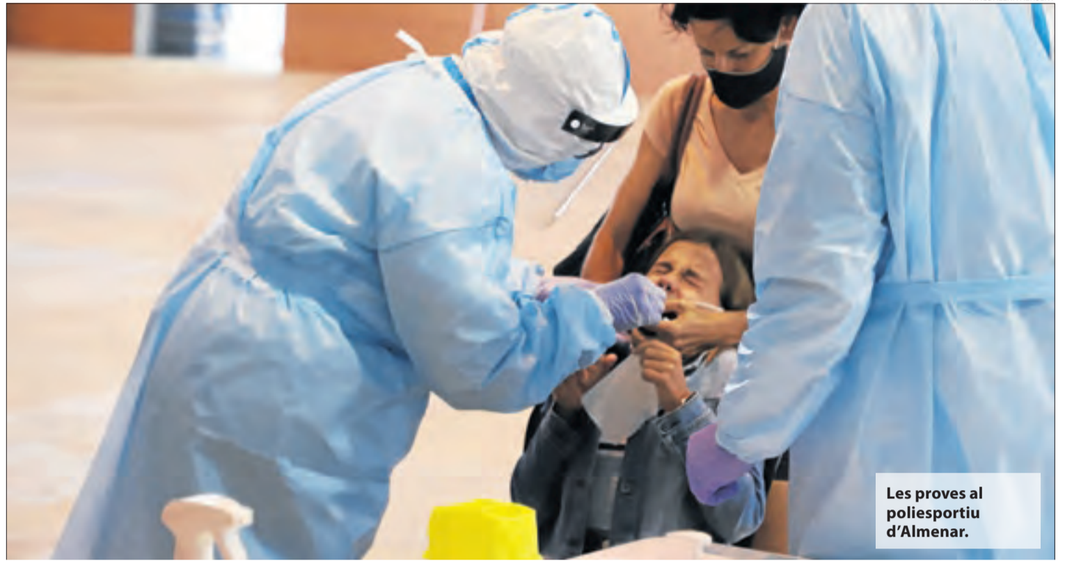
Les proves al poliesportiu d'Almenar.

Pel que fa al Segrià, el col·legi d'Almenar és el més afectat amb sis grups confinats i 126 persones aïllades; el segueix el col·legi Cervantes i els instituts Joan Oró, Torre Vicens i La Mitjana