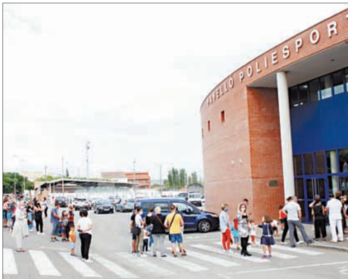
Llargues cues de gent a les portes del poliesportiu municipal per fer-se la prova PCR

L'origen de l'afectació ha vingut provocada pel positiu de dos fills de dues famílies nombroses