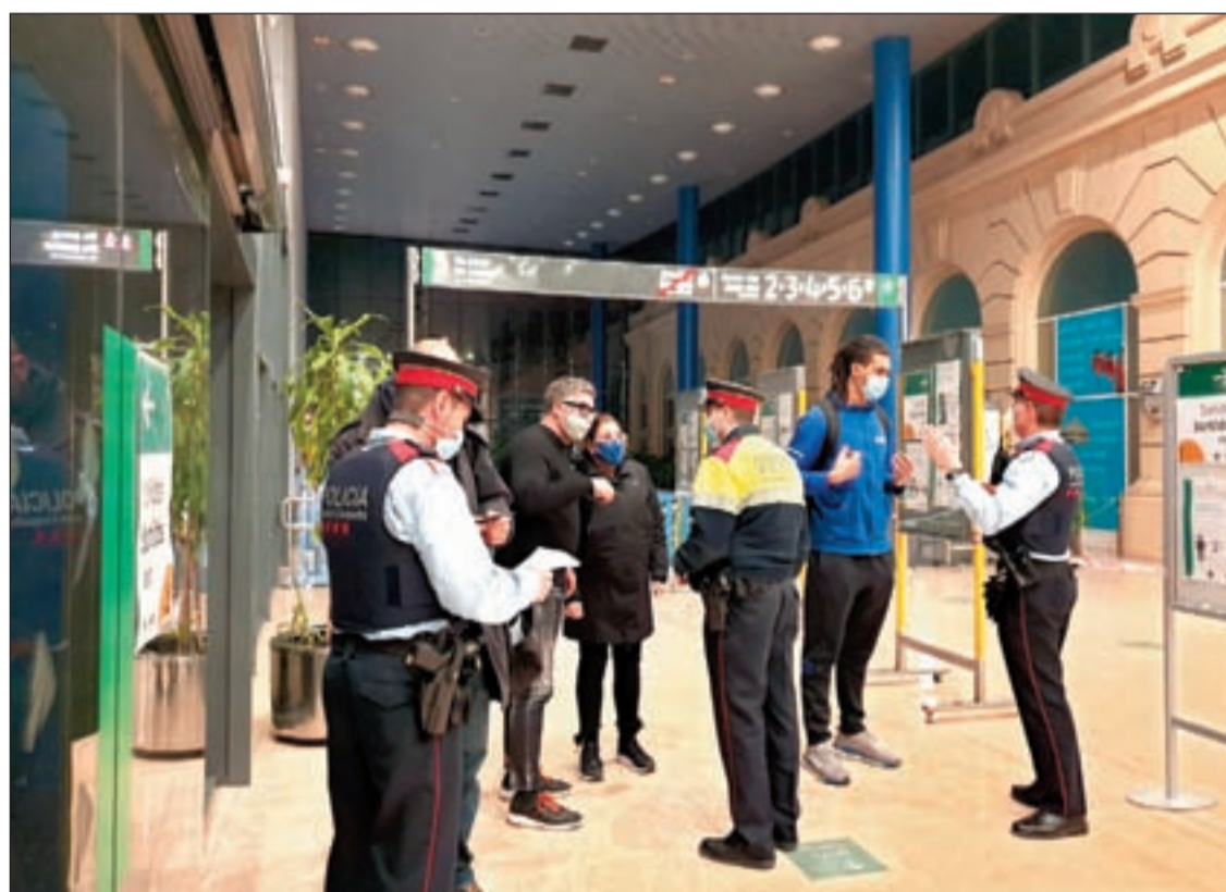
Es va fer passar pel control als viatges que entraven i sortien de l'AVE

Segons va informar Mossos d'Esquadra, aquests controls s'aniran repetint durant els propers dies, sobretot després que el Departament d'Interior alertés aquest dilluns d'un increment de les infraccions durant el cap de setmana passat. Concretament, s'han aixecat 457 actes per saltar-se el confinament municipal i 263 per incomplir el confinament nocturn. La xifra total és d'unes