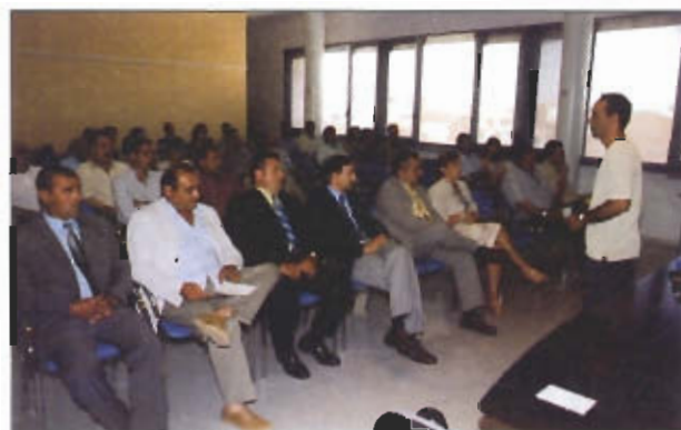
El regidor de Protocol, en funcions explica als regidors electes el desenvolupament de l'acte.

El dia 14 de juny es va constituir el nou Ajuntament de Rosselló. Els regidors i la regidora electes van prendre possessió dels seus càrrecs en un acte senzill però intens que tingué lloc a la Sala d'Actes de la Casa de la Vila plena d'invitats i visitants.