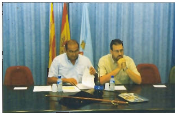
Mesa d'edat. Foto: Núria Semis

Atenció ciutadana de la Generalitat: Tel. 012