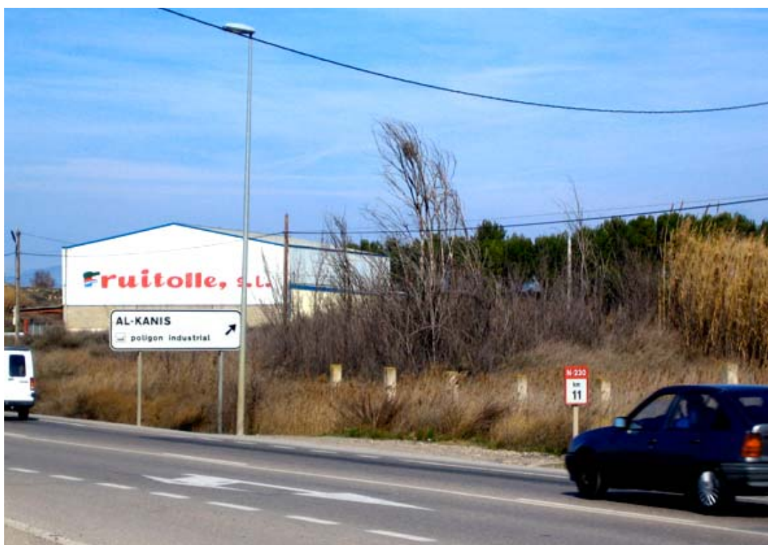
Foto 4: Àrea del SUD-1 a l'altre cantó de la carretera N-230, destinada a Serveis Terciaris.