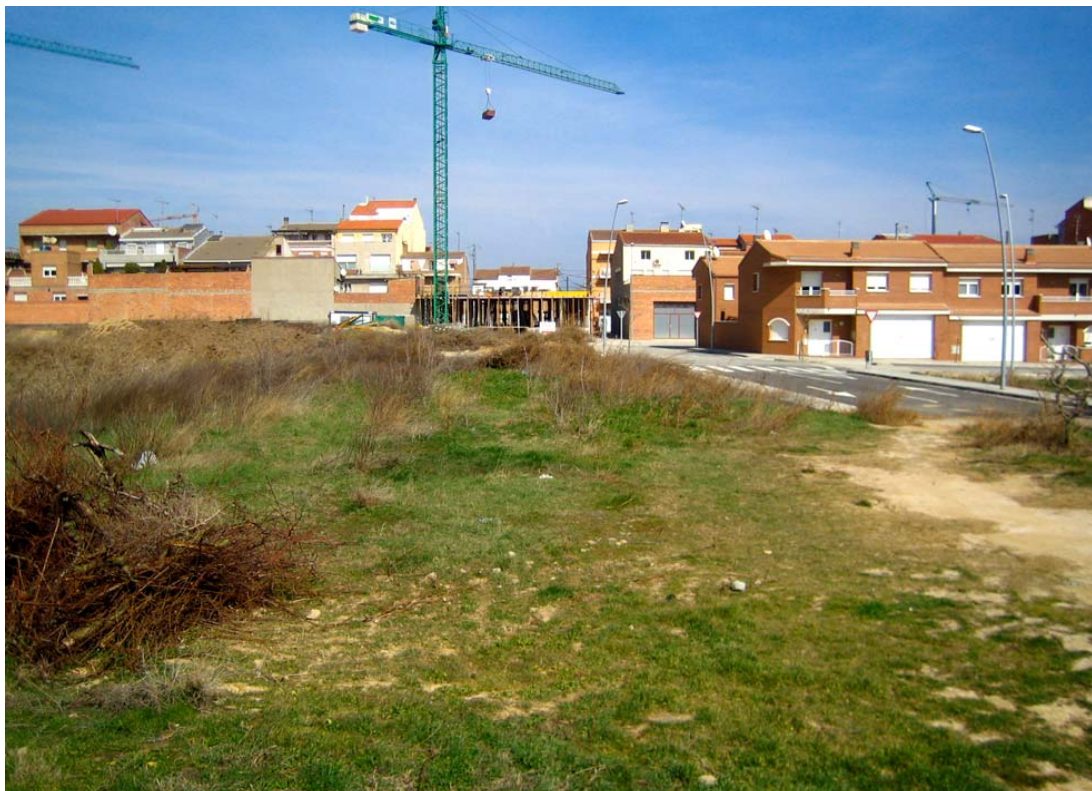
Foto 2: Transició del Pla Parcial amb la zona que actualment s'està urbanitzant.