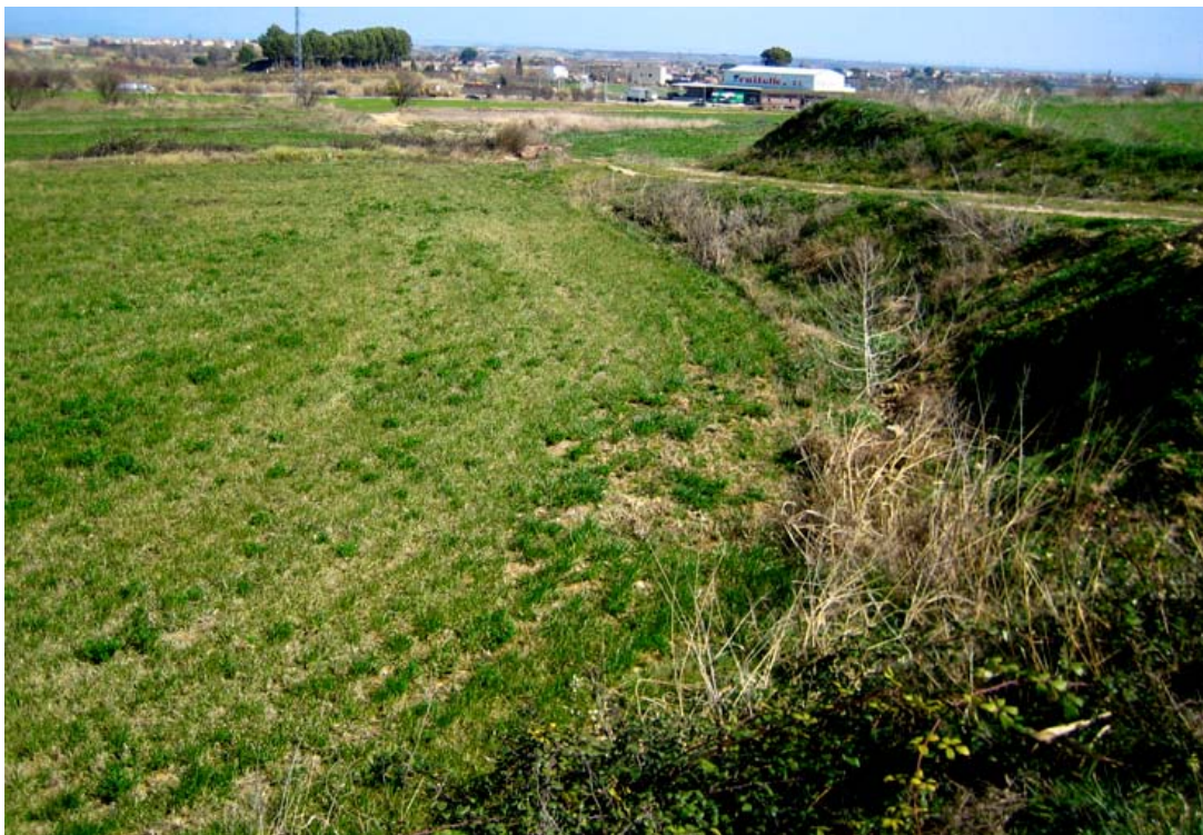
Foto 4: Vistes generals de la zona del Pla Parcial entre el Carrer camí d'Almacelles i la carretera N-230.