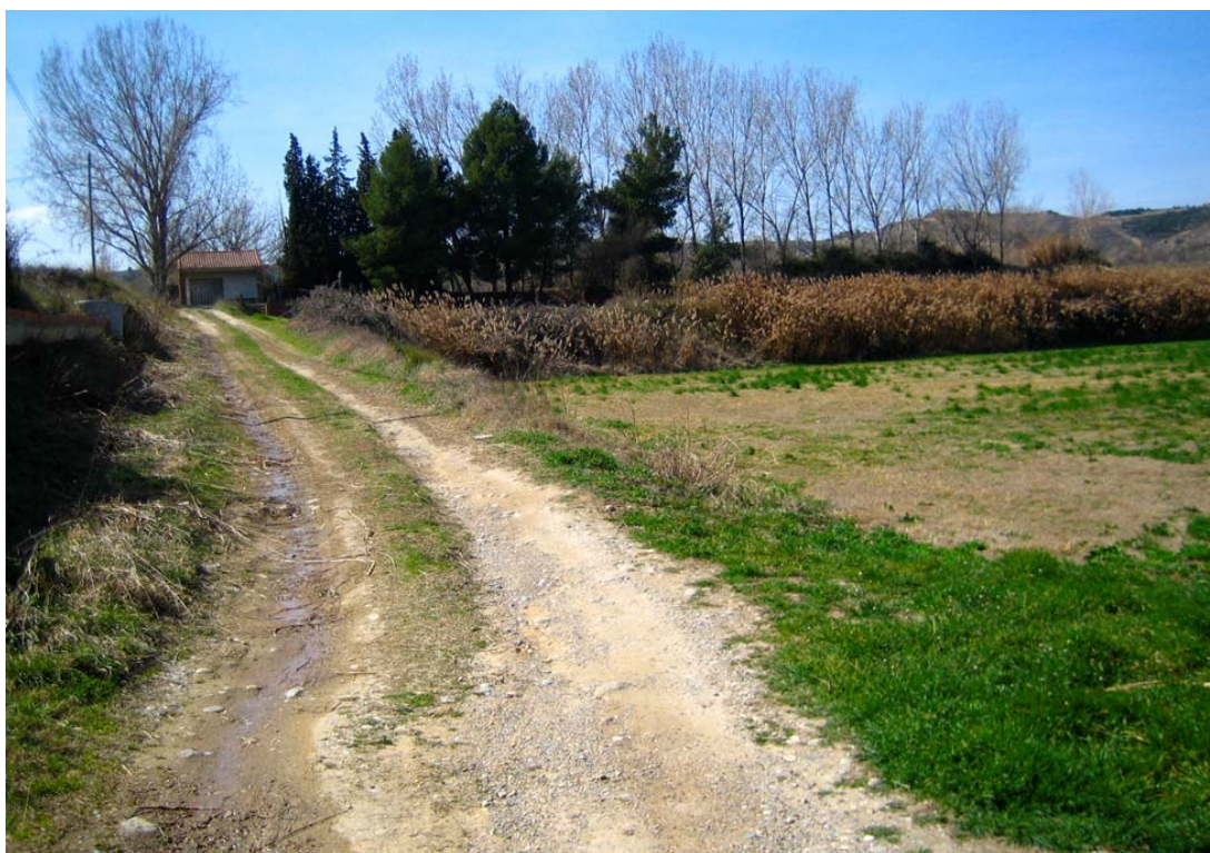
Foto 5: Única parcel·la arbrada de l'àrea afectada pel Pla Parcial SUD-1 (edificació abandonada amb plantació lineal de pollancre i alguns pins i xiprers).