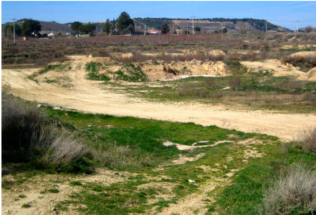
Foto 1: Vistes de tota la zona d'equipaments. S'observa la zona denudada on s'ha realitzat extracció de terres, al fons es percep el caràcter més rural de la zona no urbana.