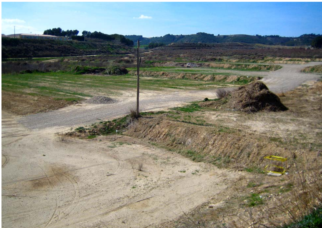
Foto 3: Vistes generals de la zona del Pla Parcial entre el Carrer camí d'Almacelles i l'actual zona esportiva.