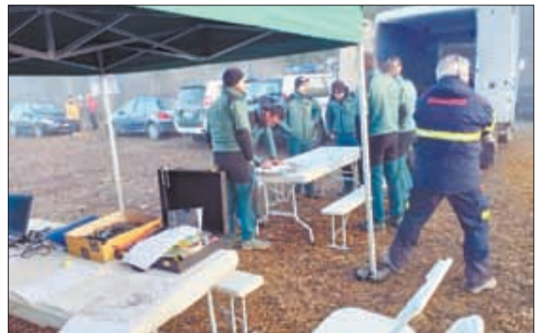
Al dispositiu d'ahir hi van participar 71 persones

La Guàrdia Civil ampliarà aquest dilluns la zona de recerca de l'ancià de 93 anys i veí de Rosselló que va desaparèixer aquest dijous quan va anar a buscar bolets amb el seu fill a Viacamp, a la Franja de Ponent. Segons van explicar ahir fonts de la Guàrdia Civil, el dispositiu començarà a buscar el desaparegut, a partir d'avui, als barrancs que hi ha prop de la zona. A la recerca d'ahir hi van participar un total de 71 persones, repartides en 9 grups, entre especialistes del GREIM, Bombers, APNs, voluntaris i un gos.