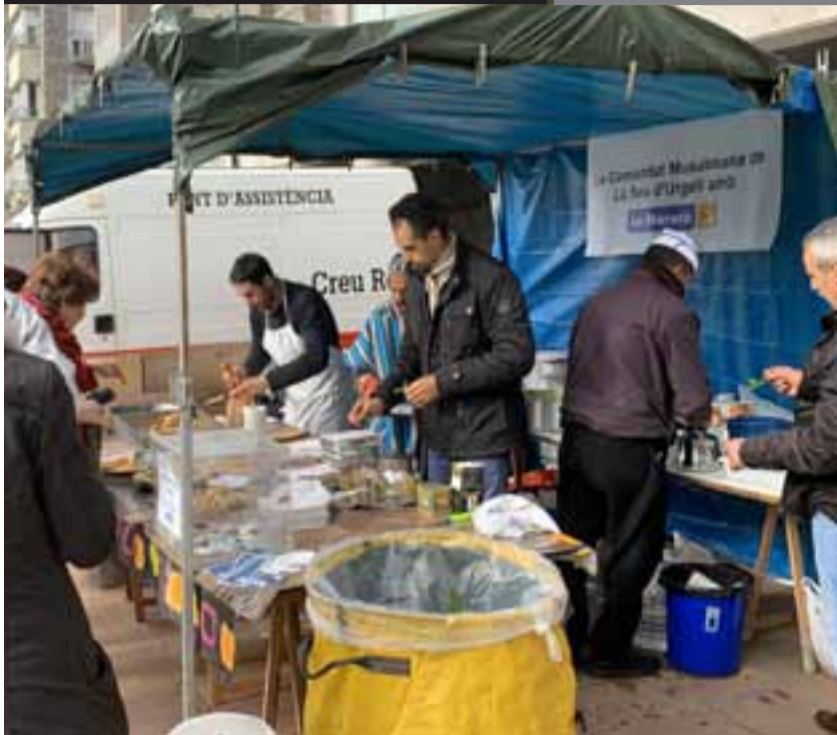
LA SEU D'URGELL · La Comunitat Musulmana de la Seu d'Urgell es va sumar a la celebració amb parada pròpia