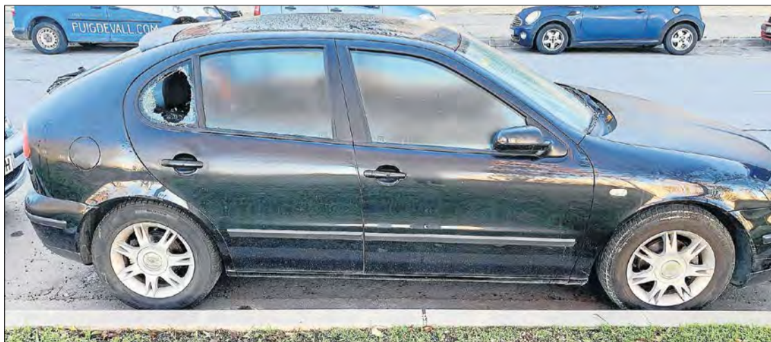
Imatge d'un dels vehicles que van ser forçats ahir a la matinada.

Val a recordar que dijous passat un lladre va ser sorprès per un transeüant a la nit mentre robava dins d'un cotxe al