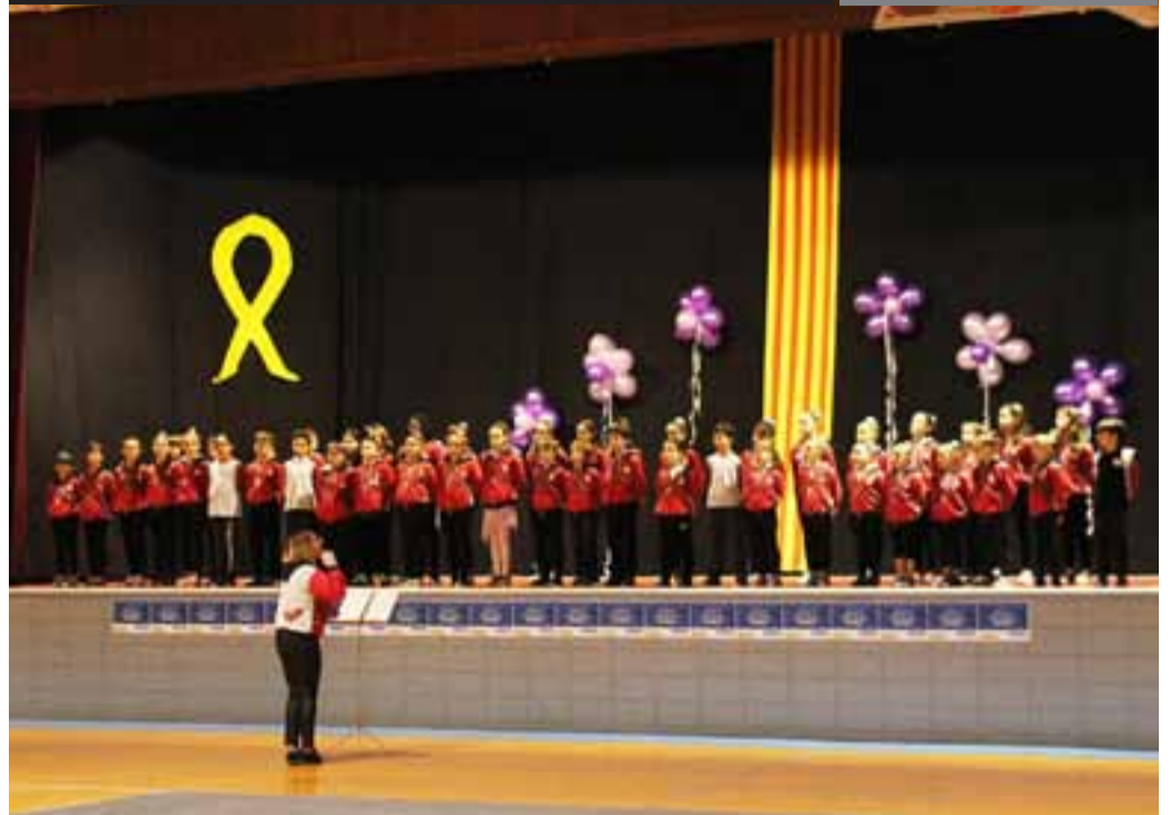
BELLPUIG · TV3 va fer una connexió en directe des del pavelló de Bellpuig durant el festival solidari que va aplegar un centenar de persones