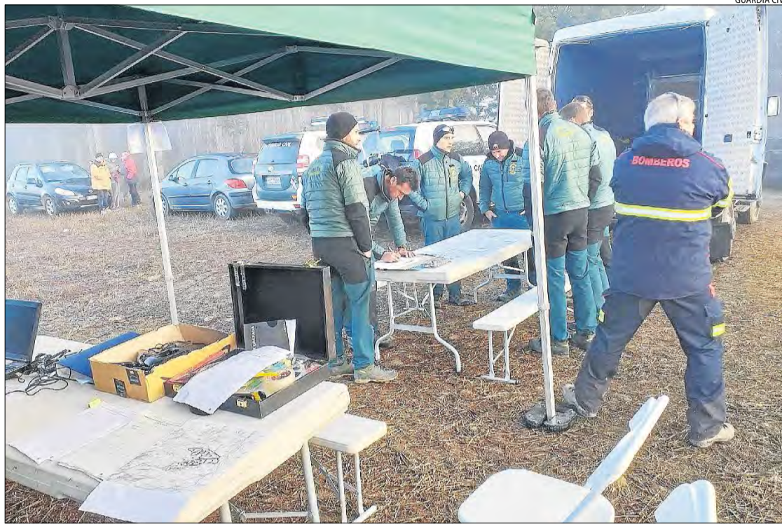
Imatge del centre de control, des d'on es coordina el dispositiu.

Veïns de la zona i de la localitat lleidatana col·laboren al costat de Guàrdia Civil i Bombers