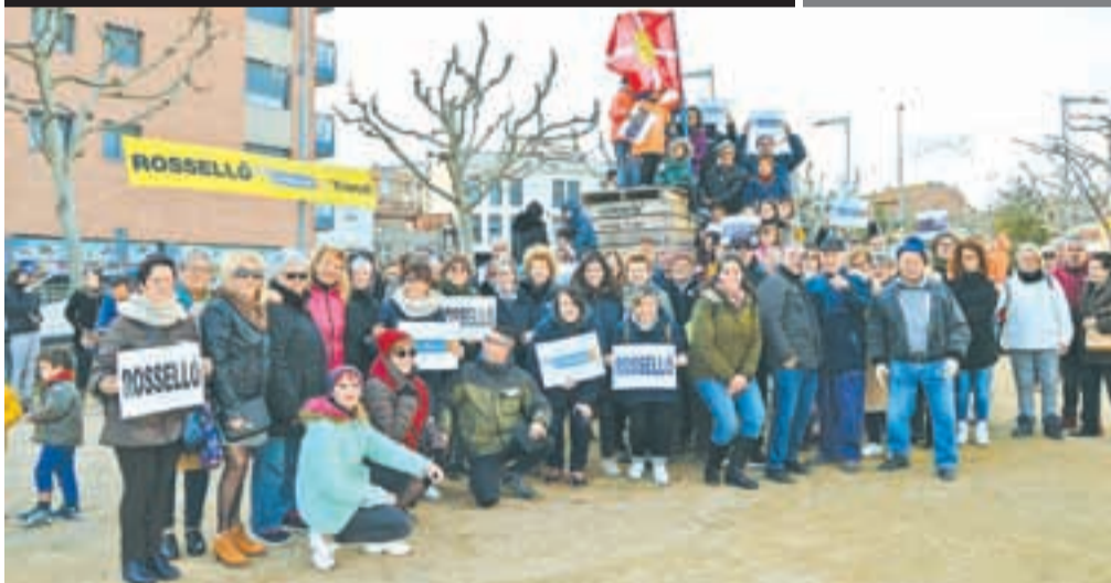
ROSSELLÓ · Els veïns i les veïnes de Rosselló van contribuir amb més de 6.000 euros en la investigació de les malalties minoritàries