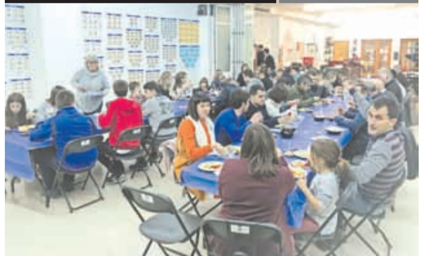
VILANOVA DE L'AGUDA · Una seixantena de persones van participar al sopar solidari i van recaptar 400 euros